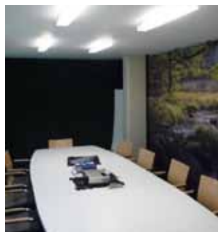
Sweden Green Tech Building

Parans är verksamt inom olika marknader såsom naturligt ljus, solenergi och traditionell belysning. Bolagets kundgrupper kan delas in i fastigheter med begränsad tillgång till naturligt ljus, ekologiskt uthålliga byggnader och privata bostäder. Hittills har Parans utgjort en nischad aktör inom sina marknader. Under år 2010 avser Bolaget att utveckla ett förbättrat system och ett större sortiment av armaturer i syfte att nå fler kundgrupper. Lanseringen av systemet beräknas därefter ske under första halvåret år 2011. Kapitalbehovet för utveckling och påbörjad lansering uppgår till cirka 6 Mkr.