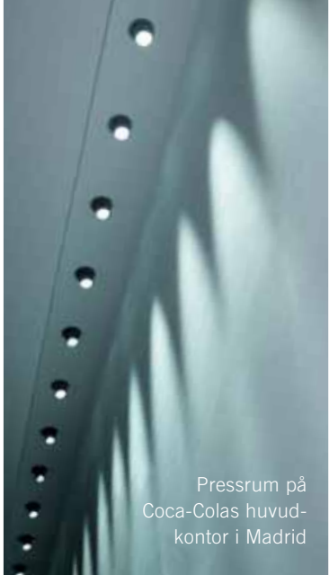
Pressrum på Coca-Colas huvud- kontor i Madrid