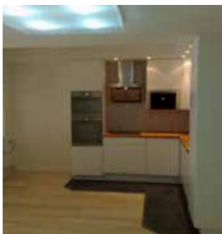
Bostadsrättsförening i Stockholm