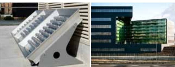
Parans SP2 installerad på Coca-Colas huvudkontor i Madrid

Idag kan Parans produkter nås på fem kontinenter genom 27 återförsäljare samt genom egen försäljning. Bolaget har hittills sålt över 100 solljussystem till kunder såsom Coca-Cola, IKEA och faktiskt även Sydkoreas presidentbostad.