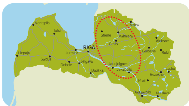
Befintligt verksamhetsområde ligger öster om huvudstaden Riga.

Fokus har tidigare legat i den norra/nordöstra regionen av Lettland – Vidzeme, Livland. Priserna på fastigheter i detta område är visserligen