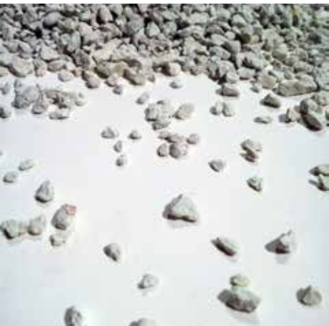
Zeolit - råvara till Aqualite™

Delstaten Telangana har tagit del av testresultaten från Kerala och liksom Kerala accepterat Josabs teknik för ekologisk vattenrening. I november 2016 slöt Josab ett kontrakt, där Josabs vattenreningsenheter ska rena vatten i 150-250 vattenkiosker i sjudmiljonersstaden Hyderabad i delstaten Telangana, Indien. De avgifter, som erläggs vid utnyttjande av vattenkioskerna, kommer att fördelas mellan Josab Indien och kontraktspartnern. Volymer i varje vattenkiosk är små, men sammantaget är den prognosticerade volymen betydande för Josab. Baserat på volymbedömningar av kontrakts-