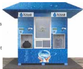
WK20A, vattenkiosk för dricksvatten