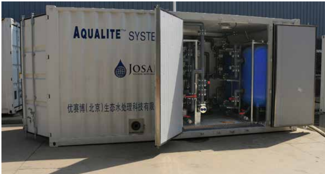
Container med vattenreningsenhet, SC900, med en kapacitet om 600-1.000m 3 per dygn. Det containerbaserade standardsortimentet uppvisar en kapacitet på 100-3.000m 3 per dygn.