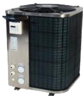
Bolagets vertikala poolvärmepump

En värmepumps verkningsgrad mäts i COP (Coefficient Of Performance, även kallad värmefaktor). Det som då mäts är hur mycket värmeenergi som genereras per tillförd elenergi. En värmefaktor på 4 eller COP 4 innebär att värmepumpen genererar en värmeeffekt på 4 kWh för varje 1 kWh tillförd elenergi. Detta kan jämföras med ett element som ger 1 kWh värme och förbrukar 1 kWh el. Värmefaktorn styrs av temperaturskillnaden mellan det medium man utgår från, och det medium man avger värmen till. Verkningsgraden för till exempel en luft/luftvärmepump, som tar värme från utomhusluften och avger den inomhus, sjunker därmed med utomhustemperaturen.