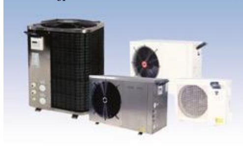
Gullberg & Janssons olika serier av poolvärmepumpar för privata swimmingpooler

Gullberg & Janssons vertikala poolvärmepump ger en lägre upplevd ljudnivå då fläkten riktar ljudet mot himmeln istället för in i trädgården. Övriga modeller är traditionella horisontella poolvärmepumpar i olika prisklasser, från rostfritt stål för kvalitetsmedvetna kunder till plast för de minsta ovanmarks-poolerna. Alla modellerna har värmeväxlare av titan som står emot både klor- och saltvatten.