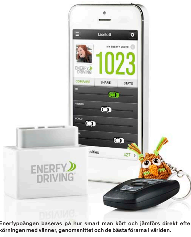
Enerfypoängen baseras på hur smart man kört och jämförs direkt efter körningen med vänner, genomsnittet och de bästa förarna i världen.