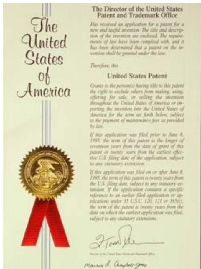
Flera av forskningsprojekten som har bedrivits inom European Institute of Science AB har resulterat i godkända patent t ex i USA.