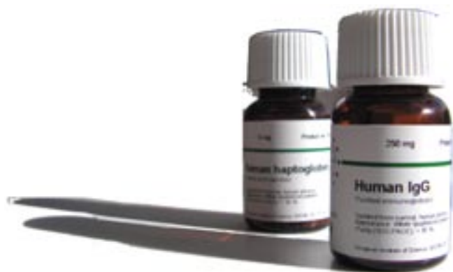
European Institute of Science AB erbjuder högkvalitativa produkter i form av affinitetsupprenade proteiner från djur och human plasma.

Under verksamhetsåret 2009 uppgick försäljningen av upprenade proteiner till 49 (1) tkr vilket utgjorde 6,9 (0,4) % av intäkterna. Under första halvåret (Q1-Q2) 2010 uppgick försäljningen av upprenade proteiner till 117 (3) tkr vilket utgjorde 31,7 (1,1) % av intäkterna.