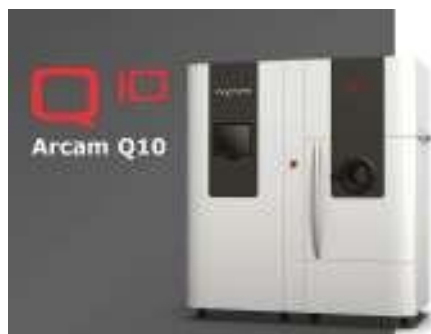
En ytterligare 3D-skrivare från Arcam ska investeras i med hjälp av emissionskapitalet.

3D-printingmetoden är snabbare, mindre energikrävande, billigare, miljövänligare och smartare än traditionella fräsmetoden. Pulvret smälts samman antingen med laserstråle eller med elektronstråle. Det är svårt att finna gränser för vad man kan göra med denna teknik.