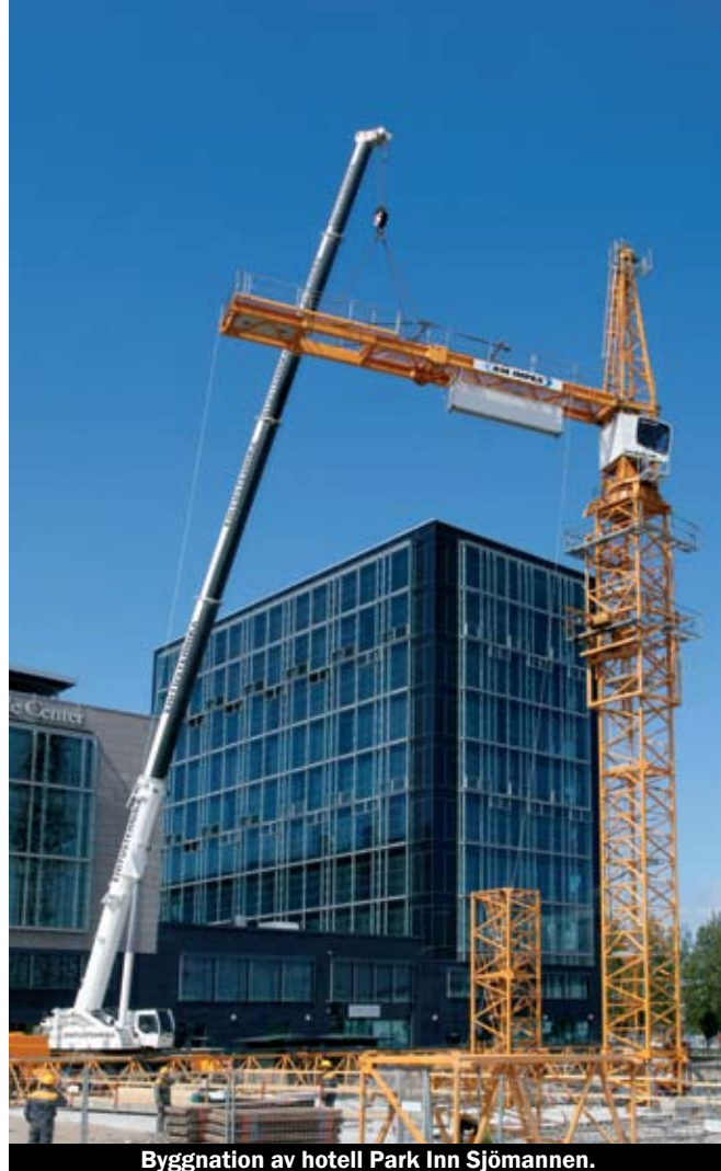
Byggnation av hotell Park Inn Sjömannen.

Sedan starten 2006 har BM Impex byggt upp ett nät av kvalitetssäkrade internationella leverantörer. Idag finns ett produktsortiment från prefabricerade betongelement till kompletteringsprodukter som fönster och dörrar att erbjuda marknaden. Bolaget vänder sig till stora och medelstora byggföretag samt projektledningsföretag som vill ha