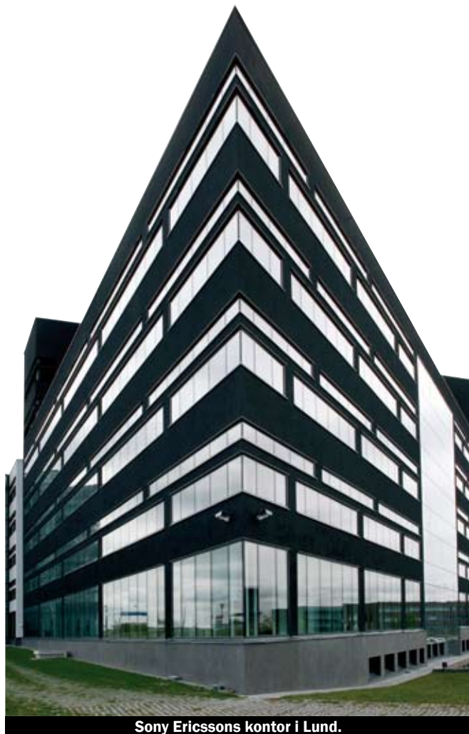
Sony Ericssons kontor i Lund.

kvalitetssäkrade produkter levererade "just in time" och till ett pris som understiger vad de kan få på den svenska marknaden.