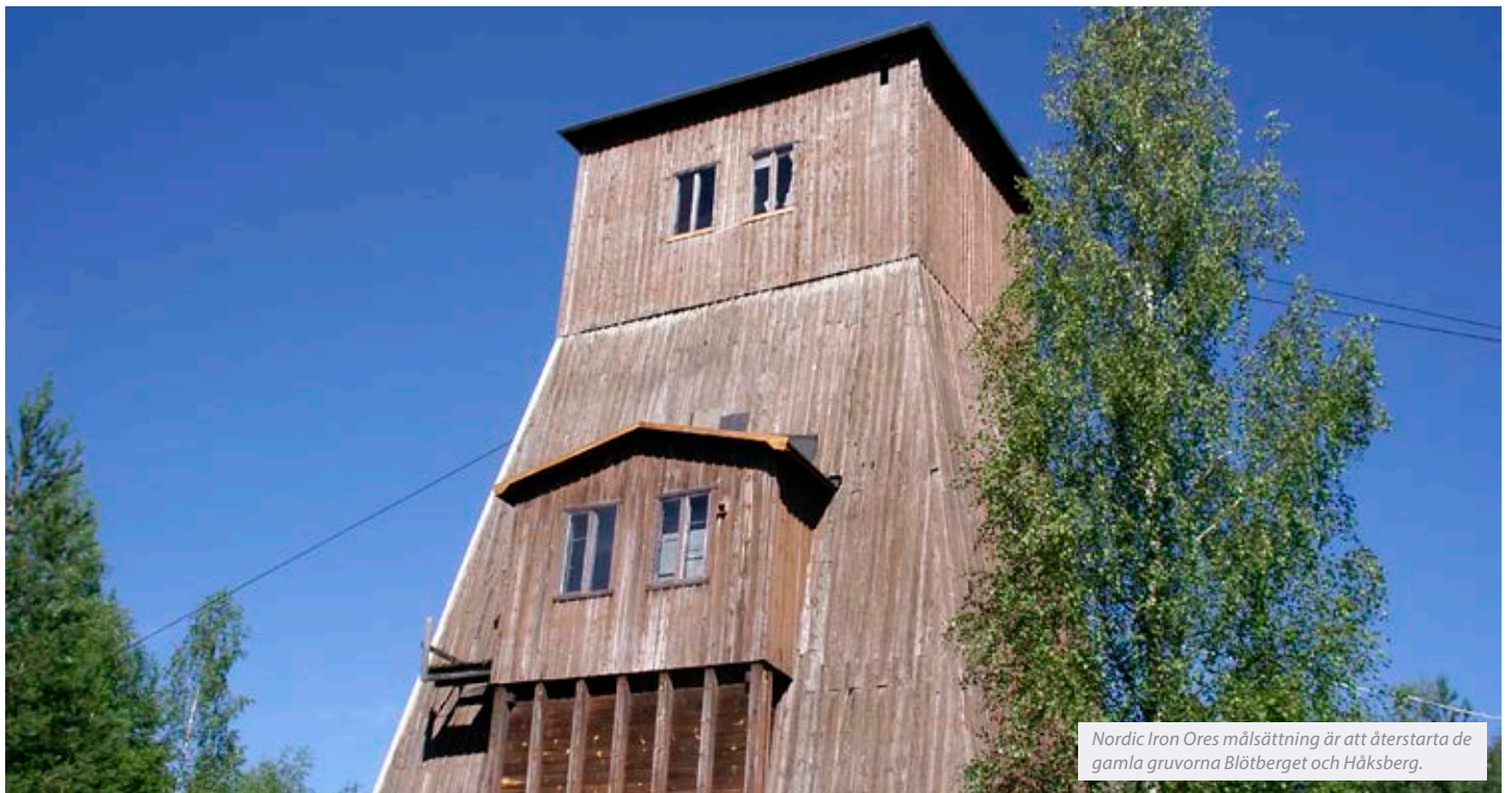
Nordic Iron Ores målsättning är att återstarta de gamla gruvorna Blötberget och Håksberg.