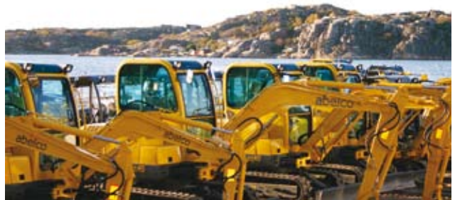
Abelco grävmaskiner på rad i väntan på leverans

Genomgående för Abelco är att bolaget köper in maskiner och utrustning i Kina av stora och kända tillverkare. Genom flera års delaktighet i produktionen och utvecklingen av maskinerna har Abelco drivit utvecklingen mot att de fått en standard som motsvarar och i många fall är bättre än, de europeiska konkurrenterna.