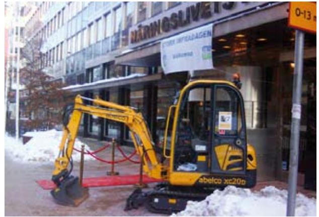
Branschens stora dag - Stora Infradagen - vid Nalen i Stockholm