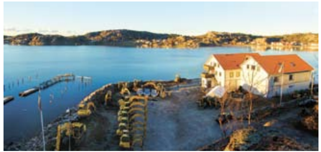
Moderbolagets huvudkontor i Bovallstrand

Moderbolaget är beläget i Bovallstrand i norra Bohuslän. I bolaget bedrivs endast koncernövergripande verksamhet.