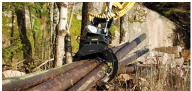
Rollertilt – en unik framtidsprodukt som transformerar en grävmaskin till en multimaskin

För mer information se: www.abelco.se eller ring 0531-531 00 00