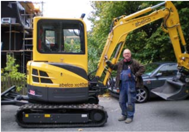
Ännu en leverans av en kortsvansad grävare till en nöjd kund