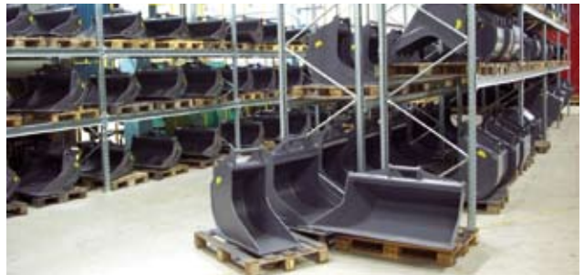
Skopor och tillbehör är en viktig del av verksamheten

Genomgående för Abelco är att bolaget köper in maskiner och utrustning i Kina av stora och kända tillverkare. Genom flera års delaktighet i produktionen och utvecklingen av maskinerna har Abelco drivit utvecklingen mot att de fått en standard som motsvarar och i många fall är bättre än, de europeiska konkurrenterna.