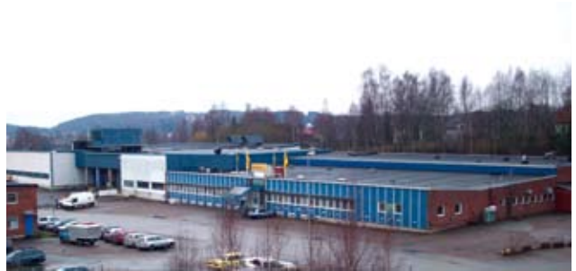
7500m 2 Montering och centrallager i Bengtsfors

I dotterbolaget Abelco Nordic AB bedrivs import, färdigställande och försäljning av entreprenadmaskiner, såsom last- och grävmaskiner samt utrustning till dem. Bolaget är det ursprungliga Abelco som startade verksamheten 2004. Numera bedrivs största delen av verksamheten från monteringsverkstaden och centrallaget i Bengtsfors. Bolaget är idag en av de största leverantörerna av minigrävare i Sverige med en omsättning på ca 35 miljoner kronor. Försäljningskontor finns i Stockholm, Örebro, Göteborg och Jönköping.